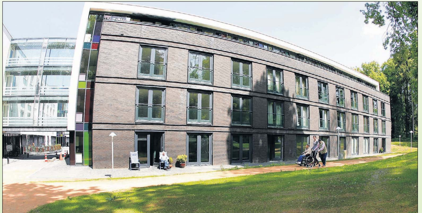
De Croonenhoff, een verzorgingshuis